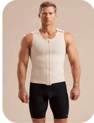
MHV Sleeveless Vest

The MHV Sleeveless Vest is longer. It can be more comfortable for some people because the longer length does not irritate the mid-section.