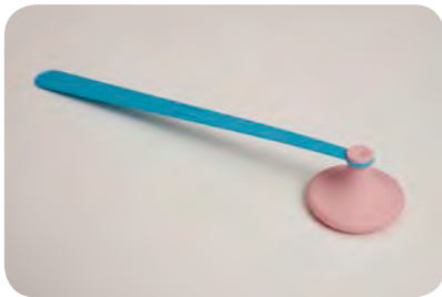
For neonates/infants, use a manual percussor