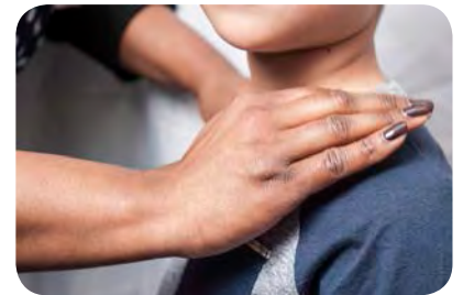
For older children, use cupped hands