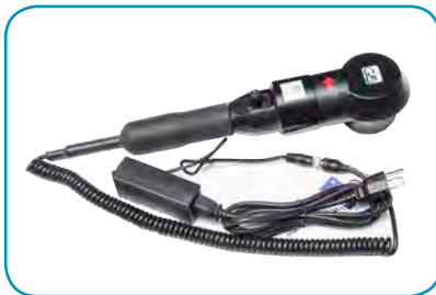
For older children, mechanical hand percussors are an option