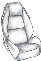
ከፍተኛ - መደገፊያ ያለው ከፍ የሚያደርግ መቀመጫ