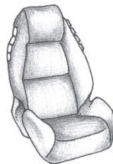
Buustarka dhabarka sare leh