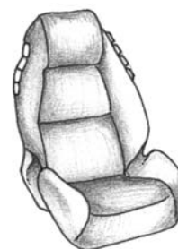
កៅអីបន្តបមានបង្អែក