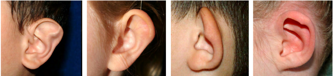
Ejemplos de orejas de forma anormal

Otro enfoque sería empezar a moldear la oreja cuando el niño es un bebé, idealmente menor de 6 meses de edad.