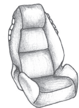
Ghế nâng có tựa lưng cao